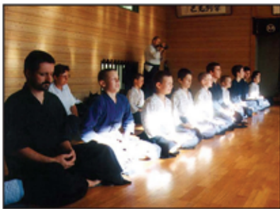
Zazen v YAMA NO DOJO, Japonsko 2000