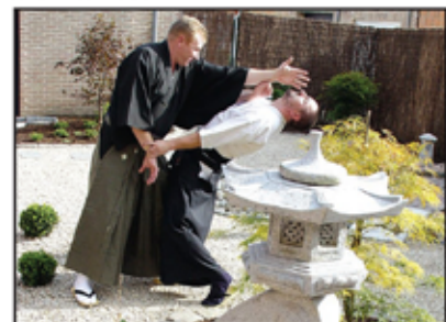
Technika HAKKO ZEME DORI.