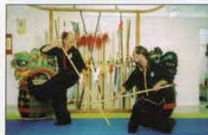
Seminář v Aténách 2004.