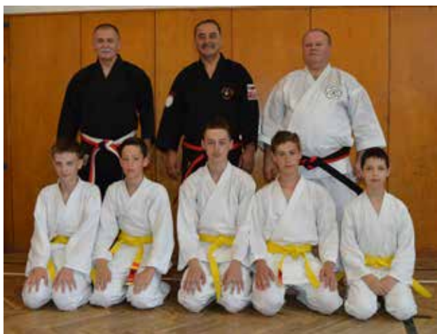
Zkoušky STV Karate Hustopeče 25. 06. 2016