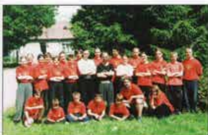
Letní seminář M.A.H.K.