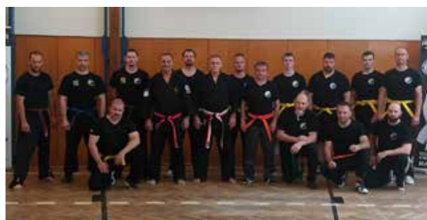
Zkoušky STV Sebeobrana Hustopeče 25. 06. 2016