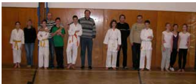
Vánoční trénink - Karate Hustopeče 22. 12. 2015