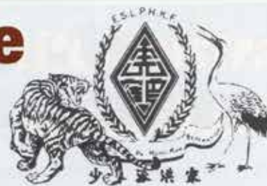
Logo M.A.H.K. tygr a jeřáb.