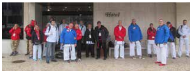
WAC 2016 Portugalsko 2016