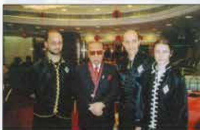
Narozeninová party, Hong-kong 2005.