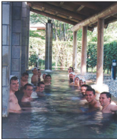
Lázně ONSEN v Hakusui pod sopkou Aso, Kjúšú, Japonsko 2000