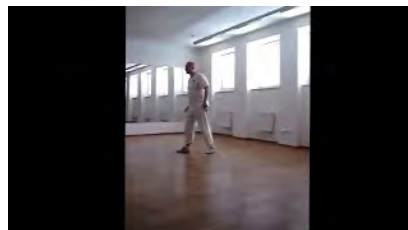
Ukázka Yaw Tai Chi Self Defence