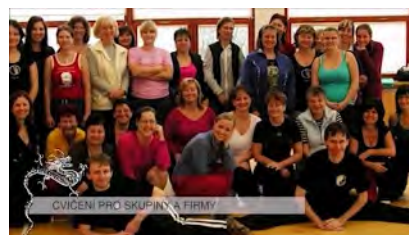
Nabídka činnosti Asia Budo Center, z.s.