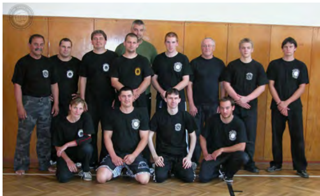
Workshop Krav Maga/Kapap Hustopeče 25. 06. 2011