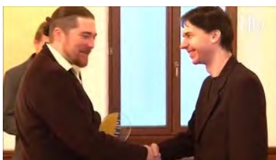
Sportovec roku 2015 města Hustopeče