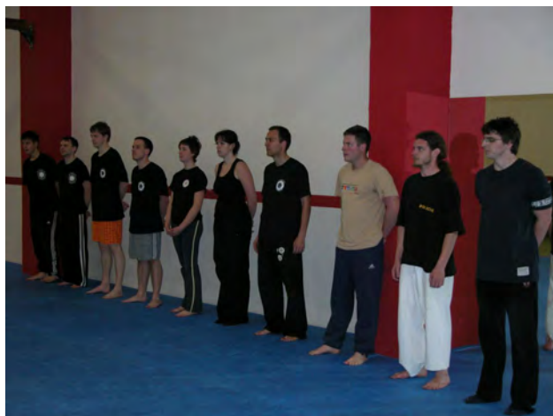
Seminář Krav Maga/Kapap Brno 21. 04. 2012