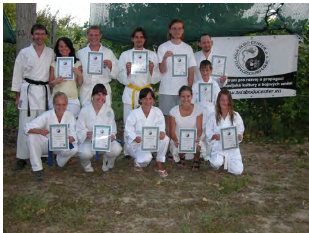
Pobyt u moře v Itálii Martinsicuro, Teramo, Abruzzo 2012