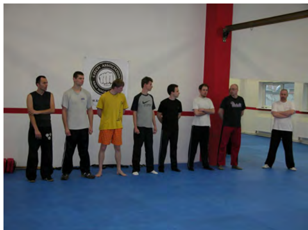
Seminář Krav Maga/Kapap Brno 07. 04. 2012