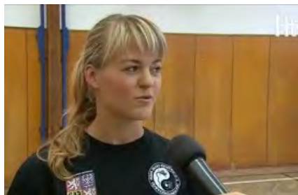
Intenzivní kurz sebeobrány a prevence kriminality 2015