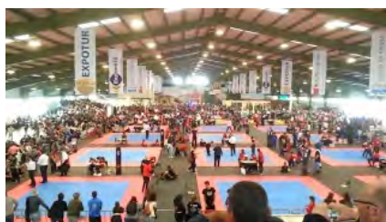
Zahájení mistrovství světa WAC & ICKKF 2016