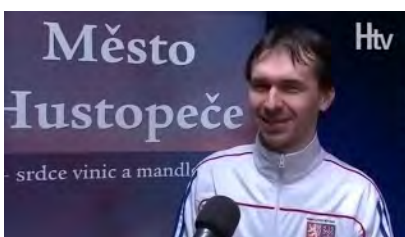
6. ročník WAC & ICKKF 2016 Portugalsko